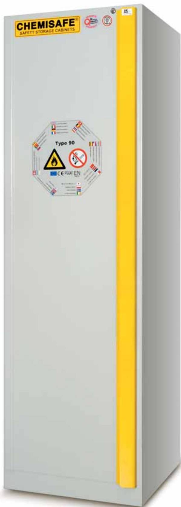
FIRE 60 EASY Type 90 - Cod. CSF239 (ripiani in acciaio inox a cremagliera). FIRE 60 EASY Type 30 - Cod. CSF339 (ripiani in acciaio verniciato fissati con pioli).